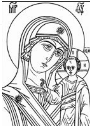
Икона Казанской Божией Матери

В заключение я хочу ответить тем людям, которые говорят нам: «Ну и что толку, что ваш дедушка стал глубоко верующим и полюбил православие, тяжело болел и умер». Но ведь жизнь земная не вечна. Земная жизнь – это подготовка