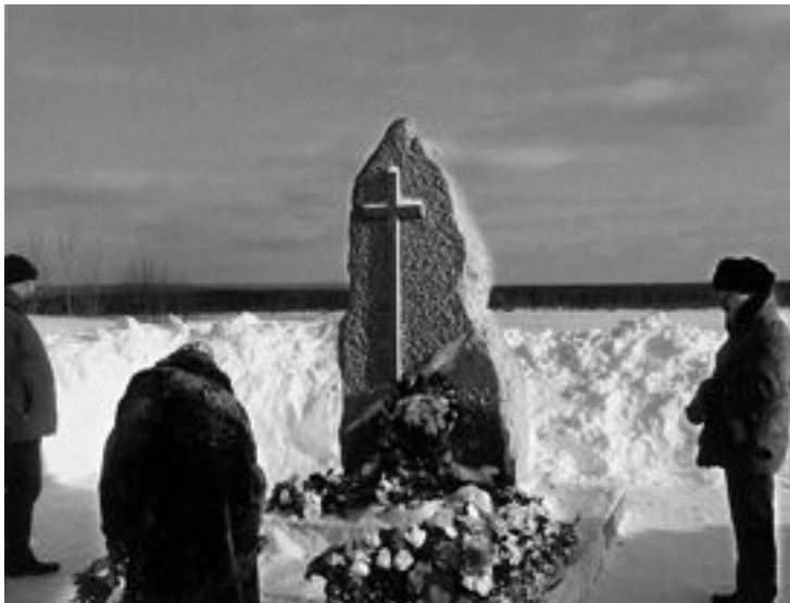
Цветы Фёдору Абрамову. Веркола, конец февраля 2010 года

Меня удивила простота жилища – нет ничего лишнего, вполне обычная обстановка, типичная для деревенских изб. С больших портретов в горнице и прихожей пытливо и внимательно смотрит