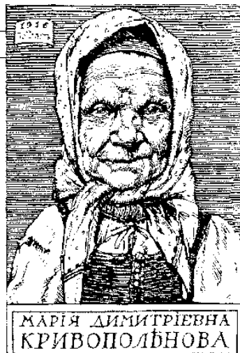
Гравюра П. Павлинова, 1916 год

– Домой попадать нать, – как ни в чём не бывало отвечала Махонька. – У вас тут какая власть?