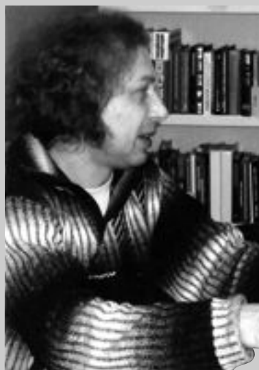
На снимках: сюжеты фестиваля