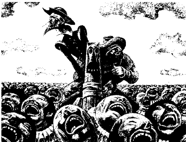
Иллюстрация Саввы БРОДСКОГО к роману М.Сервантеса «Дон Кихот» (1975)

Почему Россия, при всём откровенно плачевном состоянии своей экономики, так много гуляет, норвежцам тоже непонятно. Традиционные посленовогодние загулы в 10 дней или вот последние четыре дня неких праздников, «совмещённых» с бывшим Днём Советской армии и Военно-морского флота – это из какой оперы?! Мы что – страна всеобщего достатка, самые сытые и самые обеспеченные? Дела все сделаны – некуда руки приложить?! А тут ещё и наше насквозь пошлое телевидение заходит в сплошной праздничной истерике: «Смотри, Россия!», «Веселись, Россия!», «Гуляй, Россия!».